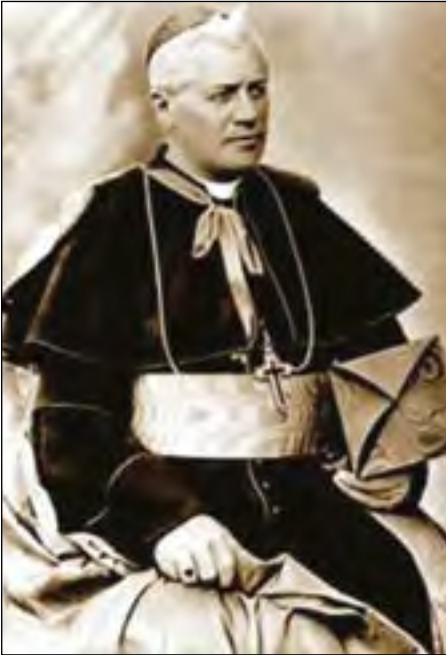
Patriarch van Venetië

spreuk: “Weg met de vijanden van de kathedraal van San Marco!” De bisschop merkt echter dat de katholieken alléén de volstreekte meerderheid niet zullen kunnen halen. Daarom laat hij de katholieke politici een verbond aangaan met de “Gematigde Liberalen”. Paus Leo XIII schrikt daarvan! Hij laat Bisschop Sarto halen. Die: “Dat zijn ‘liberalen’ die trouw de zondagsmis bezoeken, openlijk de sacramenten ontvangen en op Sacramentsdag mee de baldakijn dragen!” De paus is nu overtuigd en keurt het idee goed.