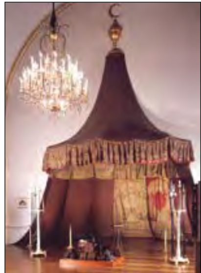
Turkse tent buitgemaakt in slag bij Peterwardein

Maar Maria beschermde niet slechts de christelijke volken in hun strijd tegen de halve maan, doch zij erbarmde zich ook over de talloze ongelukkige Christenen, die, hetzij bij de strooptochten van de Turken, hetzij bij hun overwinningen in hun macht waren gevallen. Om hen te redden riep zij door herhaalde verschijningen een kloosterorde in het leven die tot taak