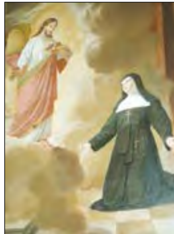
Christus verschijnt aan de H. Margareta Maria Alacoque

eenvolgens negen eerste vrijdagen te Communie gaan, de eindgenade van de boetvaardigheid zal verlenen; zij zullen niet in Mijn ongenade sterven, noch zonder de sacramenten te ontvangen;