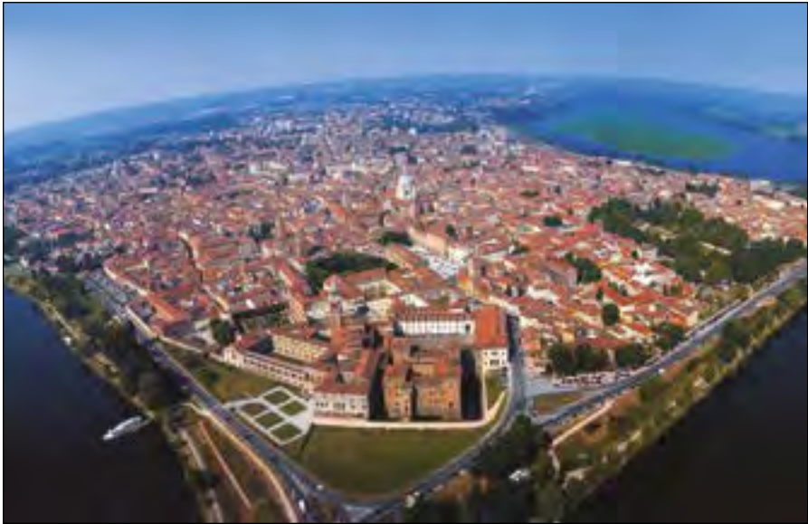
Mantua vanuit de lucht

hun toe. Bliksem in de ogen! Ieder wordt stil. Onweer! Sterke Bisschop Sarto klopt met de vuist op tafel! Hij praat langzaam maar duidelijk. Een seminarist: “Elk woord verpletterde ons bijna! We bibberden! Plots hief de bisschop ogen en armen omhoog. Uit zijn ogen kwamen tranen! Een teken dat hij ons van harte liefheeft! Dat vergeten we nooit!” Bisschop Sarto besluit: “Het kan zijn dat we elkaar nooit meer terugzien. Maar jullie zullen voor mij bidden. Want jullie weten dat ik jullie liefheb!” Wanneer hij een seminarist weer weg moet sturen en hij weet dat die jongen arm is, zorgt Bisschop Sarto er wel voor dat die aan een goed werk geraakt.