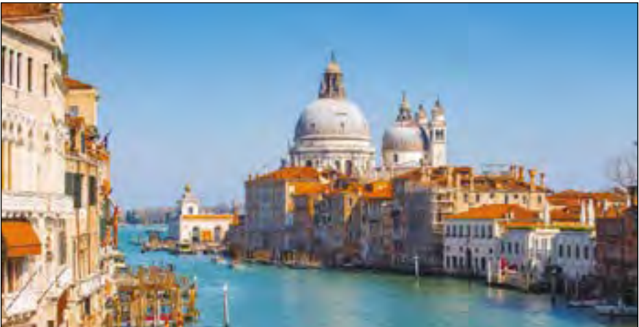
Venetië - San Marco