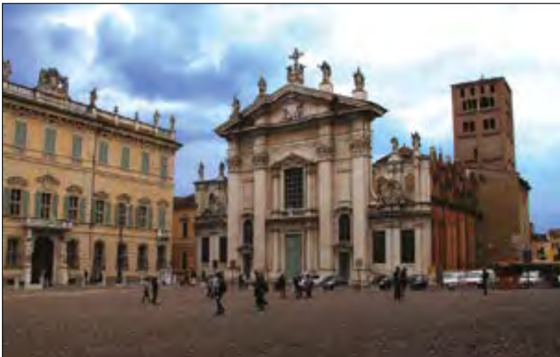
Synode - Plein in Mantua

Op 10 september 1888 luiden de klokken van Mantua. In processie trekken tweehonderd priesters naar de kathedraal. De synode is begonnen! Dat is een vergadering van alle priesters in het bisdom met hun bisschop. Om maatregelen te nemen om de zielen het best te helpen. Het is in Mantua de eerste synode sinds 1679! In alle openheid bespreekt de bisschop met zijn priesters “alles”: liturgie (de verzorging van de H. Mis en andere ceremoniën) en haar opluistering met muziek, versiering van de kerkgebouwen, processies, omgang met de wereldlijke overheid, zeden (hoe de mensen goed met elkaar omgaan of niet), huwelijken, opvoeding van de jeugd, kindcommunie en vooral geloofskennis en catechismus. Maar daar hoort Mgr. Sarto bedenkingen van een aantal priesters: “We leggen toch bij elke zondagsmis het Evangelie uit. Is dat niet allang genoeg?”