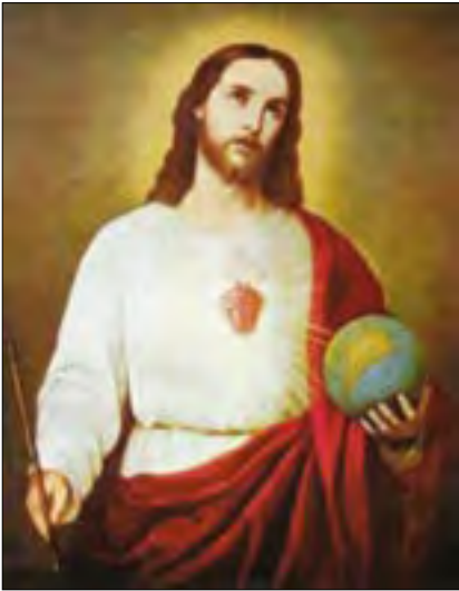
Het H. Hart geschilderd door Rafael Salas, die het schilderde in opdracht van President Gabriel Garcia Moreno voor de nationale toewijding van Ecuador in 1874.

de kusten van het vaderland te zien na een slechte en gevaarlijke reis? Ik kan niet akkoord gaan met een lijfwacht. Mijn lot ligt in Gods handen, die mij uit deze wereld zal halen wanneer en hoe Hij wil”. 1