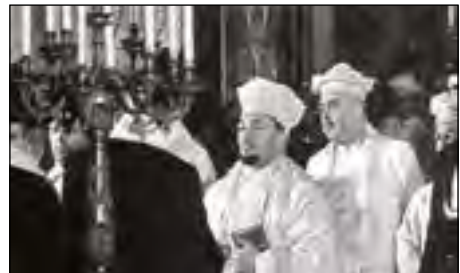
Joden in Mantua

schop Sarto onbuigzaam. Zo is het in Mantua de gewoonte dat op de verjaardag van Koning Umberto (14 maart) de bestuurders van de stad in de kerk een dankmis met plechtig "Te Deum" ("U, God, loven wij!") bijwonen. Maar daarna gaan ze naar de joodse synagoge iets gelijkaardigs doen. Alsof het voor de goede God en de zielen al gelijk is volgens welke godsdienst men leeft! Vóór de 14 e maart 1889 besluit Bisschop Sarto een einde te maken aan deze komedie. Hij laat aan stadsprefect Crispi weten: "Ofwel in de kathedraal, ofwel in de synagoge. U mag kiezen!" Crispi is woedend: "Dan in geen van beide!" Mgr. Sarto: "Tenminste heeft