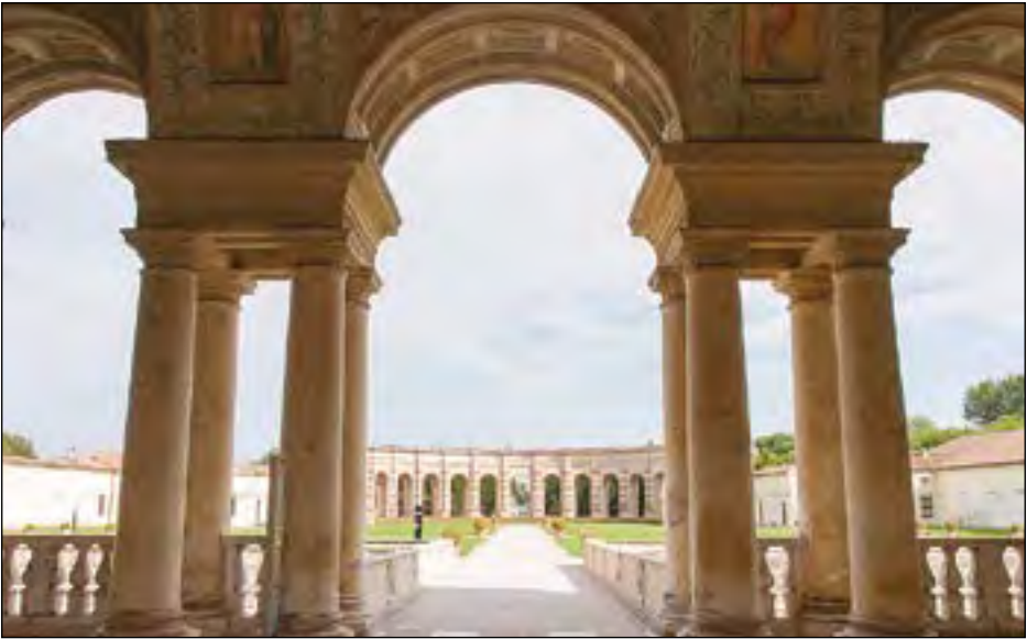
Paleis in Mantua

luistert en antwoordt met vaderlijke goedheid. Hij geeft hun frisse moed. Echt arme priesters helpt de bisschop uit eigen zak. Heeft een priester fouten begaan, maar doet hij zijn best zich te beteren, dan is Bisschop Sarto zo grootmoedig in het vergeven dat één van hen met tranen van berouw naar buiten gaat: “Wat een bisschop! Niemand kan met hem praten zonder achteraf diep ontroerd te zijn!”