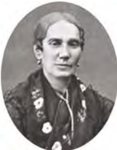
Moeder van Giuseppe Sarto