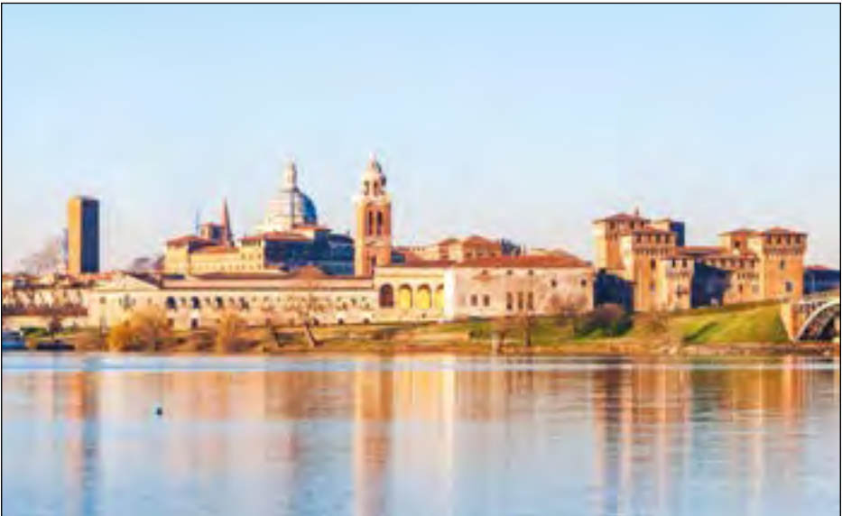
Mantua met kathedraal

Anders dan bij de eerste visitatie kondigt Mgr. Sarto het exacte ogenblik van zijn komst niet aan. Zodat iedere priester altijd paraat is! Plots staat