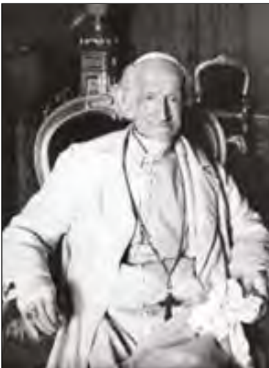
Paus Leo XIII

Op 6 januari 1884 beval zijn opvolger, Paus Leo XIII, in het kader van de antiklerikale, politieke en sociale ontwikkelingen in het nieuwe Koninkrijk Italië, dat deze gebeden over de hele wereld dienden opgezegd te worden.