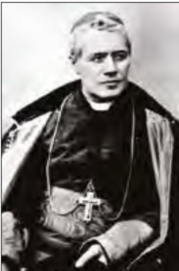
Man van staal

Zo verrast Mgr. Sarto een parochie op een zondagmiddag. Hij klopt aan bij de pastorie. De koster: “Meneer Pastoor is niet thuis!” Mgr. Sarto: “Luid de klokken! Zeg de mensen dat ik hun godsdienstles geef in de kerk!” Het volk stroomt toe. Bisschop Sarto geeft les. Na een tijdje komt ook de pastoor verbaasd binnen gewandeld. Mgr. Sarto onderbreekt: “O, Meneer pastoor is er! Meneer Pastoor, u mag de les overnemen!” De geschrokken pastoor stamelt een verontschuldiging: “Excellentie, ik was gedwongen een uitnodiging aan te