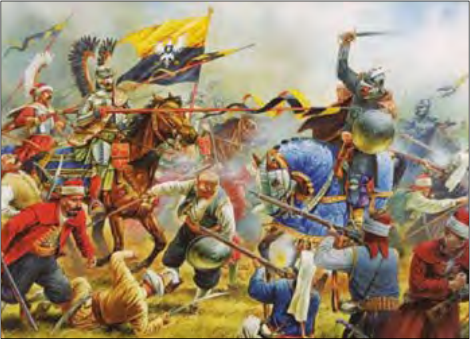
Slag bij Wenen

zij in de velden van Peterwardein in Hongarije voor goed neergehaald op het feest van O. L. Vrouw ter Sneeuw. Nogmaals schitterde Maria's bescherming zo heerlijk, dat Paus Clemens XI in het openbaar en op de plechtigste wijze zijn dank betuigde en liet betuigen voor de beslissende overwinning van de christelijke legers.