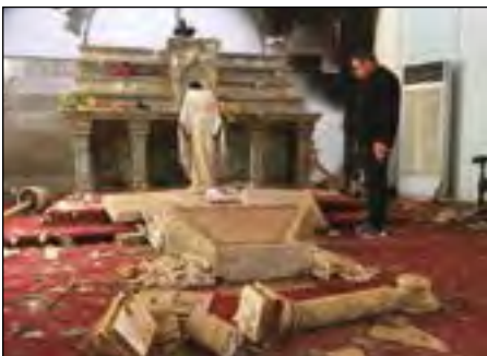
Vervolging Midden Oosten

Mohammed, die zich als een nieuwe profeet had opgeworpen, kende maar één vijand, en wel de katholieke Kerk. Haar te vernietigen beschouwde hij als zijn levenstaak en haar ondergang had hij gezworen. Des te hardnekkiger was de strijd die ontbrandde, omdat Mohammeds