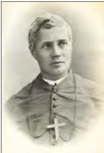
Vader voor seminaristen

En? Komen de centjes nu? Ja, werkelijk! Rijken en armen geven wat. En zo kunnen al voor het ko-