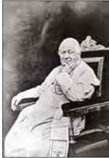
Paus Pius IX

In 1859 werd de zalige Paus Pius IX geconfronteerd met een opstand in de Pauselijke Staten. De vrijmetselarij stookte het volk op tot een burgeroorlog met als doel de eenmaking van Italië te bekomen. Deze opstand was eigenlijk voornamelijk gericht tegen Gods Kerk. Pius IX beval dat op het einde van de H. Missen die in de Pauselijke Staten gevierd werden, drie Weesgegroeten, een 'Salve Regina', een vers met antwoord en vier oraties (gebeden) dienden toegevoegd te worden. Hij maakte deze gebeden niet verplicht in andere landen, maar vroeg katholieken overal ter wereld om te bidden voor de nederlaag van degenen die erop uit waren de