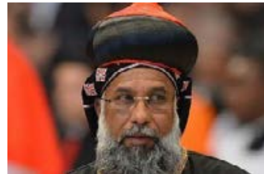
Cleemis kardinaal Thottunkal

In het noorden van India, op zo'n dertig kilometer van de stad Aligarh, hebben fundamentalistische Hindoes 72 inheemse christenen, tot de Valmiki volken behorend, die in 1995 christen geworden zijn, "bekeerd". Op 26 augustus hebben zij, in het dorp Asroi een protestantse kerk tot tempel van Shiva omgebouwd. Volgens een persbericht van katholiek AsiaNews gedateerd op 27 augustus, is het kruis dat zich op het gebouw bevond weggehaald en is er een groot beeld van de Hindoe godin Shiva op geplaatst, nadat daar een "zuiveringsrite", "shuddhi karan" geheten, uitgevoerd was.