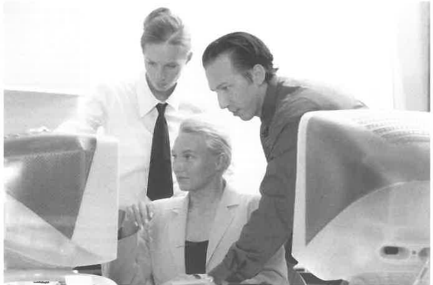
De geëmancipeerde vrouw

sen onderdrukken, meer dan dit bij de vrouw het geval is. Want bij de opvoeding van kinderen is noch de mannelijke zin voor experimenteren of beschouwen, noch het plezier in de strijd om de positie gevraagd, noch zakelijk abstrac-