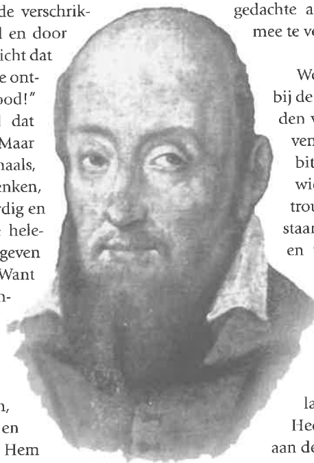
H. Franciscus van Sales

Weliswaar moeten we bij de aanblik van de zonden van ons vroegere leven altijd in vrees en bitterheid zijn. Maar wie bij enkel wantrouwen en vrees blijft staan, zonder tot hoop en vertrouwen over te gaan, die is gelijk aan een mens die van de rozenstok slechts de doornen verzamelt en de rozen laat staan. Wie op de Heer hopen zijn gelijk aan de berg Sion, die geen storm aan het wankele kan brengen (Ps 124, 1).