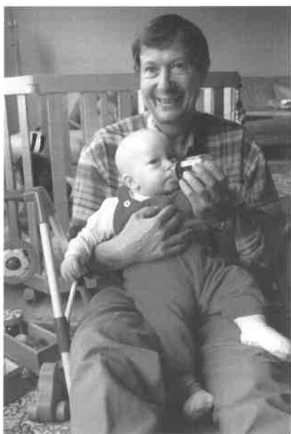
De moderne vader

Hier nog een andere passage uit het genoemde boek: "Het moet je doel zijn je man gelukkig te maken, zijn liefde te bevredigen, zodat je hem gelukkig kunt maken. En dat is het ook zeker. Je bent ongelukkig als je je man niet gelukkig maakt. Maak dus niet alleen een zachte, ordelijke, praktische indruk op hem, maar wees het ook werkelijk." En op een andere plaats staat er: "Laat u hem (de echtgenoot) dus vooral zijn volledige vrijheid. Zo kan hij helemaal op zijn eigen manier, volgens zijn luimen, bijzonderheden en wonderlijkheden handelen en leven, als hij die heeft."