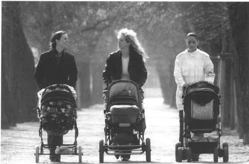
Moeders aan de wandel

Ook jongens kunnen bewonderend naar de ouderen opzien, maar tederheden zullen een gezonde jongen wel behoorlijk bevreedden. En hij zal zijn verering ook niet zo tonen of zelfs uitspreken. Meisjes, vooral de kleintjes, hebben enorm veel behoefte aan tederheid. Dat is overigens ook de reden waarom we in Schönenberg dieren houden en wel zulke, die men kan aanhalen.