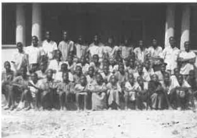
Het voorseminarie in Ngazobil, Senegal