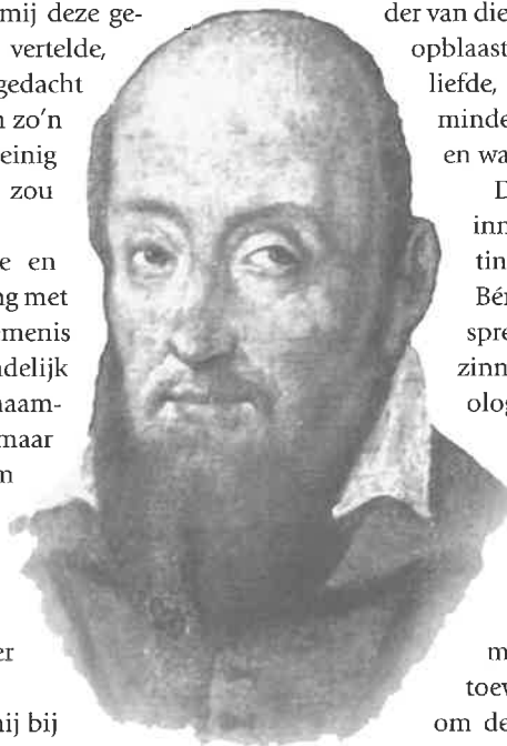
H. Franciscus van Sales

Deze uitspraak herinnert mij aan een uiting van kardinaal de Bérulle. Toen het gesprek op een zeer diepzinnige doctor in de theologie kwam, die echter bij zijn grote wetenschap onbeholpen en onhandig was, sprak hij: "Ik zou hem wat minder theologie en wat meer gezond verstand toewensen; hij zou daarom de titel van een uitermate wijs man niet minder verdienen."