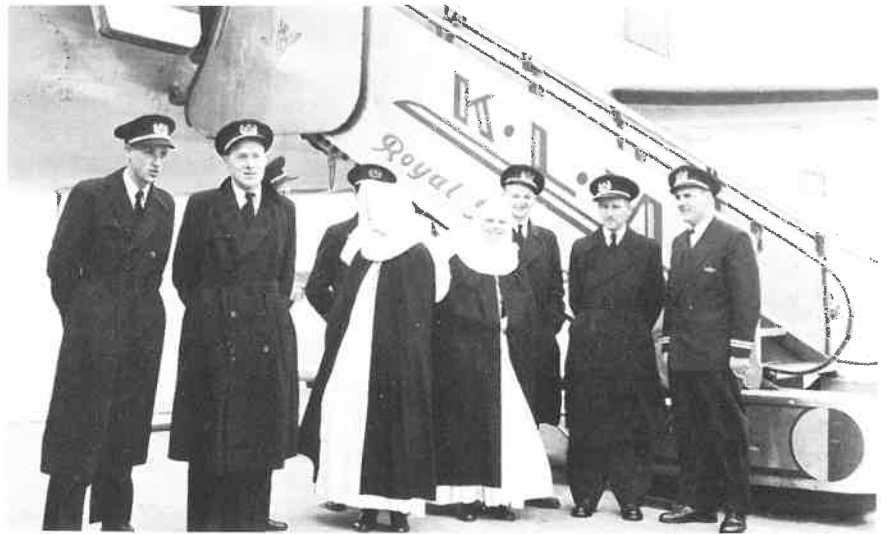
Na de Tweede Wereldoorlog verdrong het vliegtuig ook voor de missionarissen het schip als meest gebruikt vervoermiddel.

Zo zijn Wij gekomen aan een on-derwerp van niet minder belang en noodzaak: de sociale kwestie en haar oplossing volgens normen van recht-vaardigheid en liefde. Nu de commu-