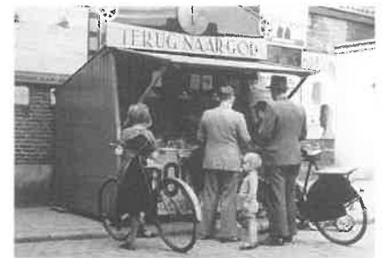
Helmond: kraam met boeken en brochures tijdens een Voor-God-dag. September 1938

ongeveer 1915 werd de vereniging meer informatieverstrekkend en wilde ze de katholieke waarheid zelfbewust uitdragen naar niet- en anders-gelovigen. De vereniging ging zich richten op de voorlichting over het katholieke geloof. Men wilde de ongelovige tegemoet treden met de schatten van de Kerk en in een vruchtbaar contact tot zijn bekering komen. Tenslotte werden vanuit de Apologetische Vereniging vanaf 1920 verschillende organisaties opgericht die de hereniging van de kerken met de katholieke Kerk moesten dienen.