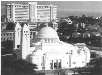
De kathedraal van Dakar