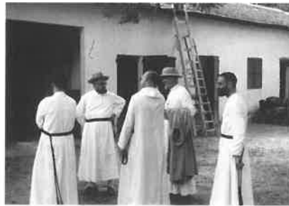
Monseigneur Lefebvre met zijn medebroeders

de kleine berghelling in Joalen in Ngazobil ("de stenen putten"). De paters nodigden de christelijke families uit om