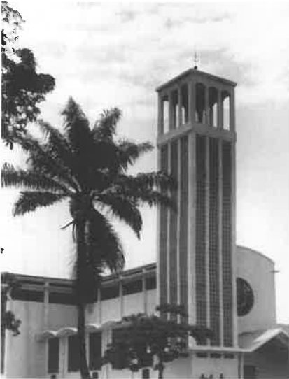
De kerk van Fatick