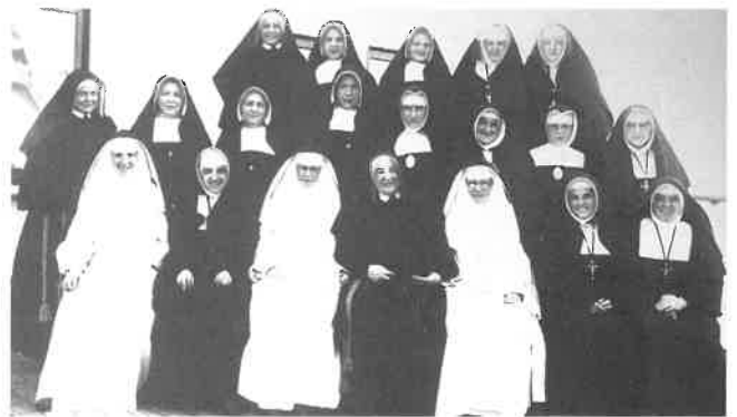
Zusters op weg naar het toenmalige Indië, 7 oktober 1931. Er waren 5 zusters JMJ, Den Bosch, 4 zusters van het Allerheiligst Hart van Jezus, Moerdijk, 3 zusters van de Voorzienigheid, Amsterdam, 3 zusters dominicanessen van Neerbosch, 3 zusters van Carolus Borromeus, Maastricht en 2 dochters van Onze Lieve Vrouw van het H. Hart, Tilburg.

In tegenstelling tot Nederland waar het katholicisme sinds de zestiende eeuw onderdrukt was, en pas vanaf de tweede helft van de negentiende opnieuw vrijuit kon opbloeien, was