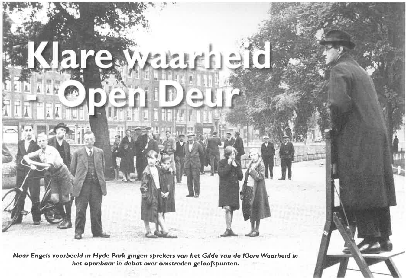
Naar Engels voorbeeld in Hyde Park gingen sprekers van het Gilde van de Klare Waarheid in het openbaar in debat over omstreden geloofspunten.

In de decennia vóór het concilie werd door de katholieke Kerk met diverse middelen geprobeerd om missionair bezig te zijn. Vanuit de theologie bood zij uitzicht op de voltooiing van de verlossing. Ze gaf aan iedereen en overall uitleg over haar leer; vreesde nergens katholiek op te treden en vragen en aanvallen van niet-katholieke zijde te beantwoorden. Geloofsverkondiging en geloofsverdediging stond hoog in haar vaandel omdat ze zich bewust was van haar zending door Jezus Christus: de Weg, de Waarheid en het Leven. Middels diverse initiatieven, broederschappen, devoties, het leven van de geestelijken en de missies, werd gepoogd de katholieken met deze theologie vertrouwd te maken, ze van de waarheid en de waarde ervan te overtuigen en ze te helpen om de idealen van het geloof in het werk te stellen. Daarnaast behartigde de Kerk niet alleen de spirituele, maar door middel van de katholieke sociale organisaties ook de wereldlijke belangen van de katholieken. In deze organisaties konden katholieken sociale contacten aangaan, konden ze deelnemen aan activiteiten voor scholing en vrije tijd en konden ze als leek verantwoordelijkheid overnemen in de maatschappij en in de Kerk. Zo werd via de Kerk, zowel in religieuze als sociale zin, een gevoel van zelfbewustzijn gegeven.