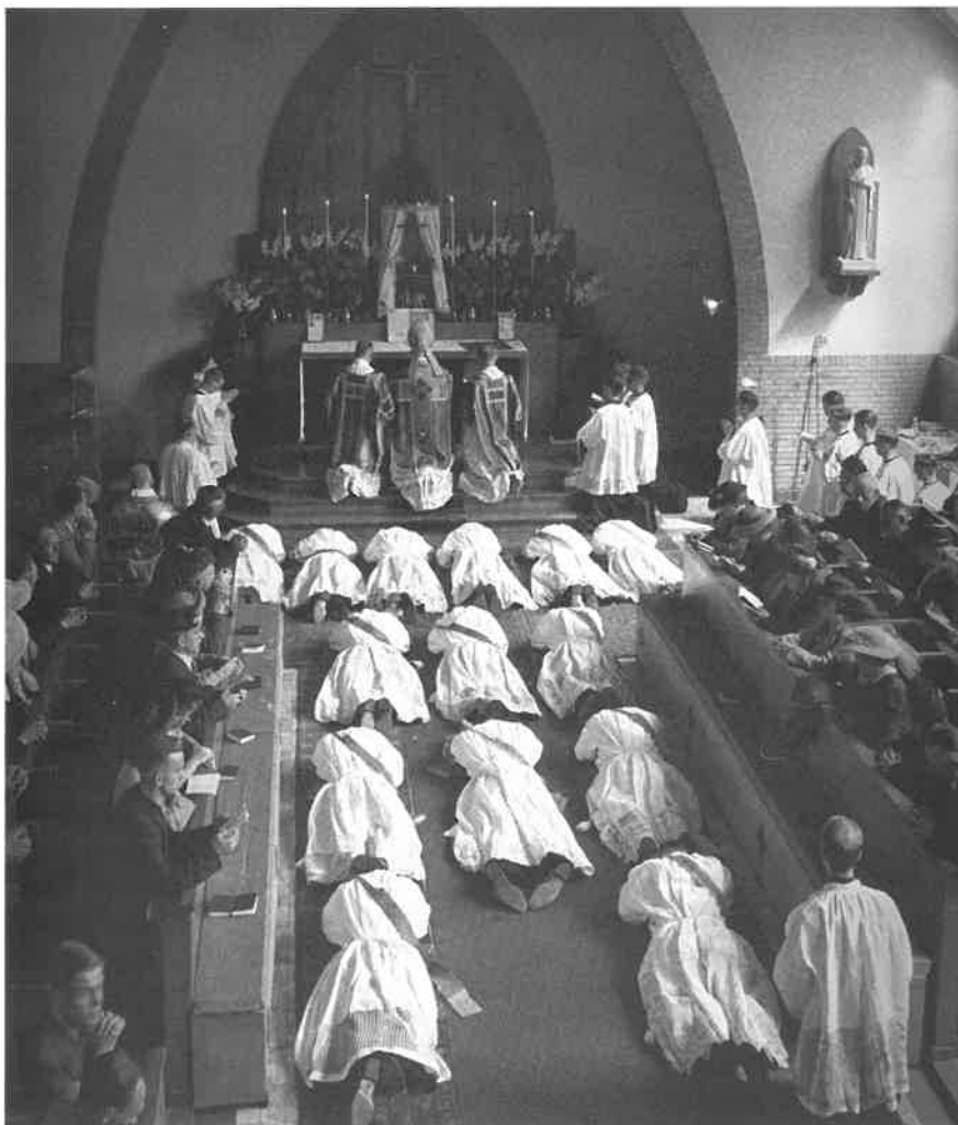
Priesterwijding van missionarissen voor de Paters van de H. Geest in Gemert

Diepe droefheid vervult Ons bij de gedachte aan de kwellingen, het lijden en de dood van deze onze geliefde kinderen. Niet alleen onze vaderlijke gaat naar hen uit, maar ook onze vaderlijke en eerbiedige verering, omdat Wij maar al te goed weten, dat hun sublieme roeping soms tot de waardigheid van het martelaarschap wordt verheven. Jezus Christus, onze eerste Martelaar heeft gezegd: "Heeft men Mij vervolgd, dan zal men ook U vervolgen" (Joh. 15, 20); "in de wereld hebt ge verdrukking te lijden: Ik heb de wereld overwonnen" (Joh. 16, 33); "zo de graankorrel niet in de aar-