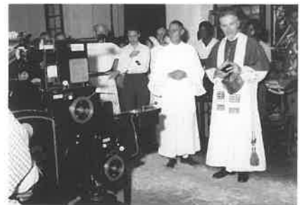
Inzegening van de drukkerij in Dakar

Aan de vooravond van de oorlog verandert Pius XI de naam van het vicariaat "van Senegambia" in die "van Dakar", en die van de prefectuur "van Senegal" in prefectuur "van Saint-Louis van Senegal". Gambia wordt apostolische prefectuur, evenals Casamanca, on-