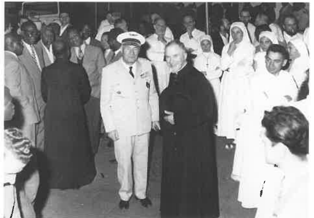
Afscheid van Senegal

"En", legt hij uit, "dat kon ik zeggen tegen mgr. Lefebvre"!