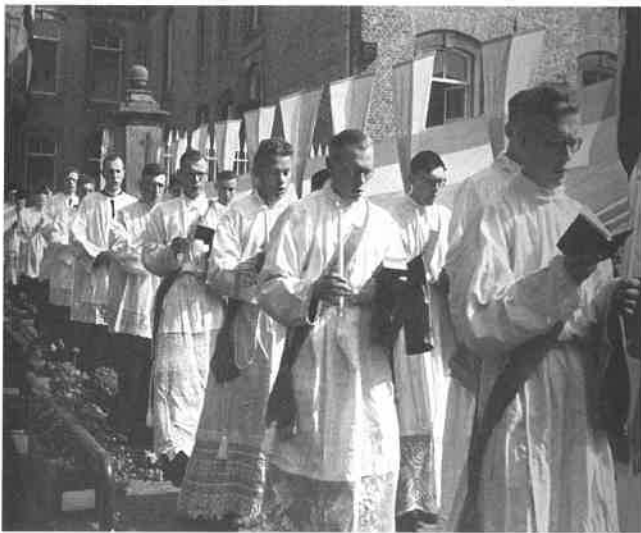
Processie van wijdelingen, paters van de H. Geest, missionarissen, kasteel Gemert.

Op geografische kaarten kan men dit illustreren door het tekenen van symbolische inktvlekjes die abdijen en steden voorstellen. Naarmate de eeuwen voorbijgaan, wordt men er omwille van de overzichtelijkheid toe genoopt nieuwe kaarten te maken omdat er steeds meer van die inktvlekjes op aangebracht dienen te worden. De resultaten van de missiëring zijn aldus vrij goed zichtbaar voor wie met geschiedenis begaan is. Vanuit steden en abdijen heeft het christendom gaandeweg ook het platteland gewonnen. Tegen de tijd van de kruistochten was het bijna helemaal gekerstend Europa bedekt met kerken waarvan de grootte, zelfs in afgelegen gebieden, enerzijds wijst op de behoefte aan voldoende opvang voor een bestaande bevolking, en anderzijds op het bekomen vermogen