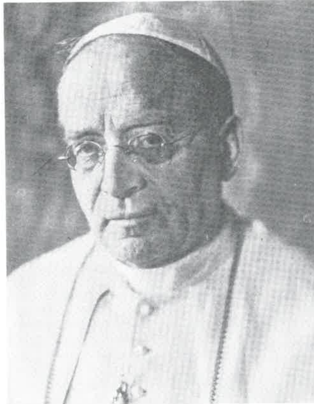
Pius XI, van 1922 tot 1939 paus, heeft met zijn encycliek Mortalium Animos zoets als een Magna Charta voor de hereniging van de christenen opgesteld. Die encycliek blijft de veilige toetssteen van een ware katholieke oecumene.

Het voorconciële Rome wees deze congressen af. De reden daarvoor was het vasthouden van de absoluutheids-