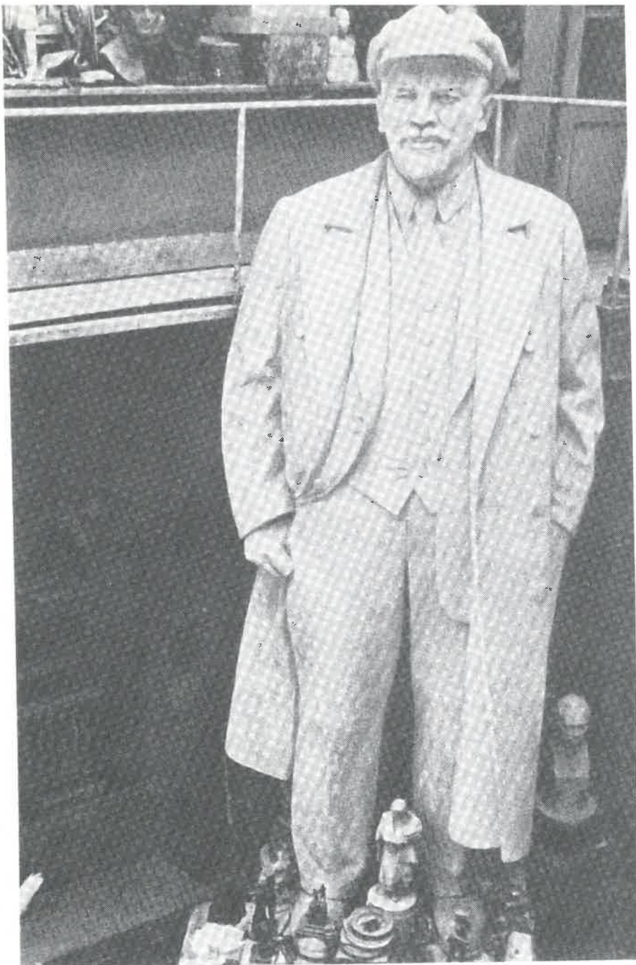
Een standbeeld van Lenin (1870 - 1924) in een antiekwinkel: wordt door de perestrojka het communisme werkelijk uitverkocht?

Op dit ogenblik is Rusland nog niet door de Paus in vereniging met alle bisschoppen van de wereld aan het Onbevleekt Hart van Maria toegewijd. Zolang dat niet gebeurd is, zal Rusland zijn dwalingen over de wereld blijven verspreiden. De verandering van tactiek door de communisten is geen bekering. Rusland blijft communistisch.