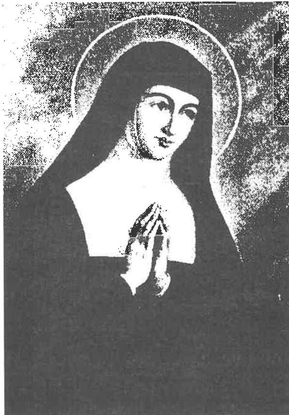
Met de H. Hartverering is onafscheidelijk de naam van de H. Margaretha-Maria Alacoque (1647 - 1690) verbonden.

Zo bereiken wij het midden van de 17 e eeuw. Het H. Hart wordt het voorwerp van een eredienst en krijgt zijn feest. Dat zal het werk zijn van twee grote heiligen: pater Johannes Eudes en Margareta-Maria Alacoque.