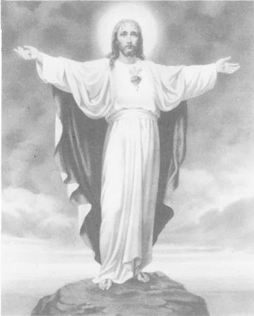
"Komt allen tot Mij, die vermoeid en belast zijt, en Ik zal u verkwikken."

- de kinderen worden opgehitst om zich los te scheuren van hun ouders (de verklaring van de rechten van het kind); - het egoïsme van de man wordt geprikkeld (sexualiteit, toerisme met sexuele omgang); enzovoorts.