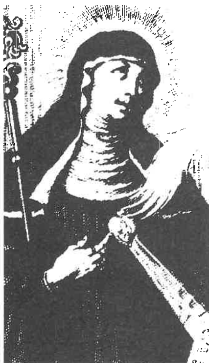
De H. Gertrudis van Helfta (1256 - 1302), abdes en mystica, wordt meestal met het H. Hart van Jezus afgebeeld.

De door de Heer bijzonder beminde Apostel zal bij het Laatste Avondmaal de weg openen voor de devotie tot het Heilig Hart van Jezus. Hij zal ook de aard ervan bepalen voor de toekomst. In de ogen van de Kerkvaders, tot de H. Bernardus in de bloeitijd van de middeleeuwen toe, zal het H. Hart een plaats van rust en vereniging met Jezus zijn. En wel meer een levens- dan alleen een liefdesband, want het hart van Jezus is vooral een bron van leven. Toen de honderdman de zijde van de Zaligmaker met een lansstoot opende, werd, zegt de H. Johannes Chrysostomus, "de bron van onze zaligmaking" aangeboord. Er vloeiden bloed en water uit, de oorsprong van de Sacramenten en het begin van de Kerk. Als de H. Augustinus over de door de H. Johannes vermelde lansstoot spreekt, zegt hij: "De evangelist heeft opzettelijk een heel speciale uitdrukking gebruikt. Hij zegt niet: hij 'trof' of 'verwondde' Hem, maar: hij 'opende' de zijde van de Heer om ons te doen begrijpen dat hij zo de levensdeur opende waaruit de Sacramenten van de Kerk gekomen zijn".