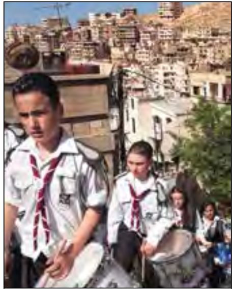
Christelijke Scouts in Syrië

Zoals de Fadelles worden vele christenen in islamitische landen vervolgd, ook door hun eigen familie, als daar moslims bij zijn. Erger nog gaat het, als ze in handen vallen van moslimbenden als Al-Nusra-Front of Islamitische Staat (Isis). De christelijke mannen worden gekruisigd of hun hoofd wordt afgesneden. De jongetjes krijgen met een mes een Arabische letter 'N' (van 'Nazareeër' dat is 'christen') op hun borst gekrast. Wat er met de meisjes en moeders gebeurt, is nog veel erger. In Nigeria heeft de islamitische Boko-Haram-bende bijna driehonderd meisjes ontvoerd en tot slavinnen gemaakt. Een ding is zeker: in al deze landen bloeden en sterven onze christen zusters en broeders voor Jezus en voor het ware geloof. Ze hebben ons gebed en offer hard nodig om sterk te blijven en Jezus niet te verloochenen en over te lopen naar de christenmoordenaars. Als we deze beide maanden genoeg opoffe-