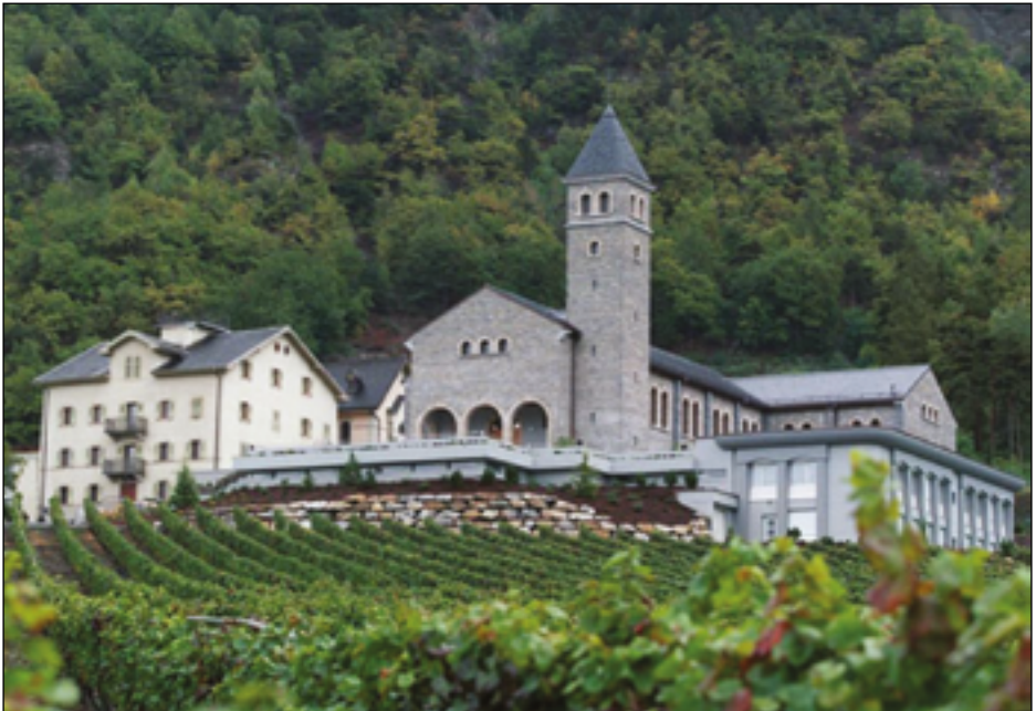
Het Seminarie van de H. Pius X in Écône, Zwitserland