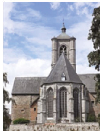
Kerk van 's Gravenbrakel