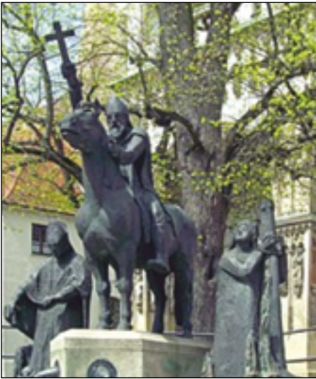
Standbeeld St. Ulrik van Augsburg

Ulrik: “Wie het H. Sacrament van het Vormsel wil ontvangen: alles weer in orde brengen wat je hebt misdaan! Gestolen goed terug! En zonder het H. Vormsel laat ik jullie niet toe te huwen of een klooster of kathedraalschool (om priester te worden) binnen te gaan!” Of Koenraad: “Mijn goede christe-