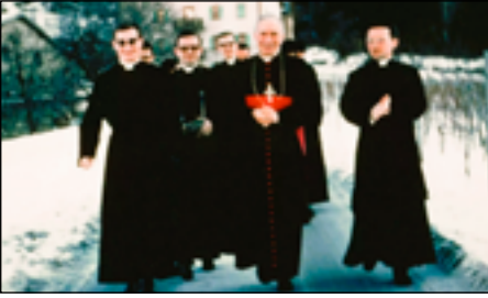
Mgr. Lefebvre, het begin in Ecône

op de voorgrond, hij staat ten dienste van de H. Maagd en het Kind Jezus, hij beschermt ze en leidt ze tijdens hun leven. Hij zal verborgen sterven, zonder de publieke manifestatie van deze vrucht gekend te hebben, van zijn daad om Maria te hebben gehouden. Hij zal geen wonderen van Jezus meemaken, hij zal Jezus enkel kennen van het leven in Nazareth.