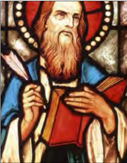
H. Mattheüs Evangelist

Omdat God niet eenvoudig alleen dicteert, maar de schrijvers van de heilige boeken op een diepere manier heeft geleid, zijn de eigenaardigheden van de menselijke auteurs bewaard gebleven. Een zwakke vergelijking kunnen we vinden in het volgende: wanneer wij iets schrijven, dan ziet men aan het resultaat welk schrijfinstrument we gebruiken hebben: een vulpen, een balpen, een potlood, een oude schrijfmachine of een computer. Zo was ook iedere menselijke auteur slechts een instrument voor God, om de Heilige Schrift te schrijven, maar omdat God de mensen op een zo diepe manier leidt, heeft iedere auteur zijn persoonlijke stijl bewaard, en we kunnen daaruit in sommige gevallen iets van zijn karakter en zijn ontwikkeling aflezen.